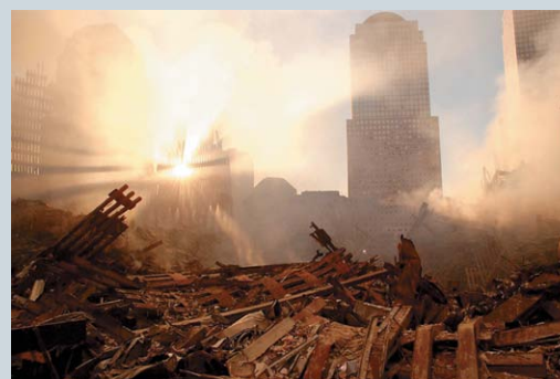
Солнце пробивается сквозь пыль, освещая развалины Всемирного торгового центра 15 сентября 2001 года.