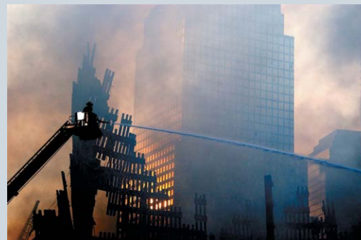
Вид с воздуха на часть руин Всемирного торгового центра 17 сентября 2001 года после террористической атаки. Соседние здания сильно пострадали от обломков во время падения башен-близнецов.

Еврейская традиция говорит о том, что каждый шалаш во время праздника символически посещает кто-то из семи высоких гостей, которые приходят, чтобы благословить хозяев. Каждого из гостей, пришедшего в сукку в эти дни, можно воспринимать, как такого высокогостя. Интересно, но, наверное, на этот счет и сказано: «Страннолюбия не забывайте, ибо через него некоторые, не зная, оказали гостеприимство Ангелаам» (Евр.13:2). Но здесь не