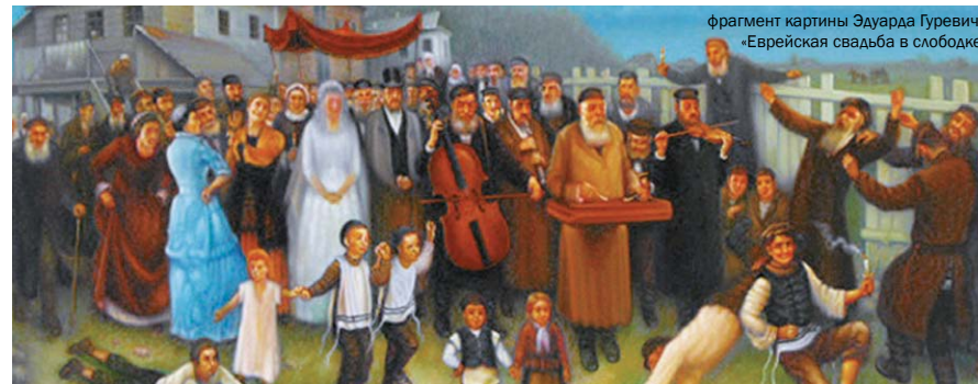
фрагмент картины Эдуарда Гуревича «Еврейская свадьба в слободке»

Приезжая сюда, многие из них смогли сохранить только память о своем еврействе, совершенно утратив веру. Но есть те, которые, возвращаясь в землю отцов, приносят в своих сердцах драгоценные крупницы веры, пронесенные их предками через тысячелетия, веры в Бога Авраама, Исаака и Иакова. Эта вера пахнет кровью и слезами, потому что ее сохраняли и пронесли сквозь ужас крестовых походов, сквозь бесконечную череду бессмысленных и жестоких погромов, сквозь удушье газовых камер, пепел печей крематориев и звук пулеметных очередей у бесчисленных, наспех выкопанных рвов. Эта вера бесценна. И она сегодня жива. Она непостижима. Как и прежде, она вызывает трепет, страх и ненависть у одних, восхищение и восторг у других.