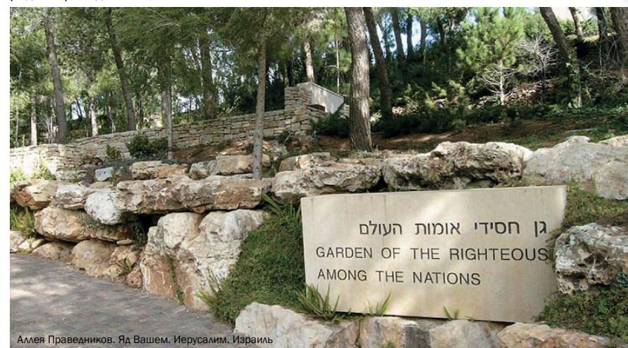
Аллея Праведников. Яд Вашем. Иерусалим. Израиль