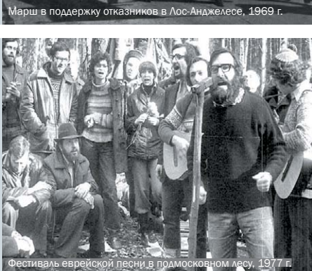
Фестиваль еврейской песни в подмосковном лесу, 1977 г.

(посмотреть фильм можно на портале «Зов Сиона» - Документальные фильмы в разделе Киноклуб : http://callofzion.ru/pages.php?id=1232 )