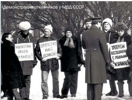
Демонстрация отказников у МВД СССР

24 февраля 1971 года в 11 часов утра министр внутренних дел СССР Николай Щелоков получает экстренное сообщение – захвачена приемная Президиума Верховного Совета СССР! Щелоков растерян. Событие неслыханное по тем временам: террористы в самом центре Москвы, почти у Кремля! Поверить в происходящее невозможно.