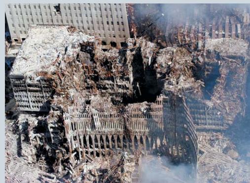
19 сентября 2001 года пожарные все еще продолжали сражаться с огнем, вырывающимся из-под завалов Всемирного торгового центра.