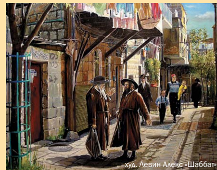
худ. Левин Алекс «Шаббат»

попросил деньги, а у меня их не оказалось, что ты подумал обо мне?» «Подумал, что, наверное, ты вложил их в какое-то прибыльное дело». «А когда я сказал тебе, что у меня нет домашнего скота?» «Подумал, что ты одолжил его другим людям». «А когда ты услышал от меня, что в моем доме нет вообще никакого имущества?» «Я решил, что ты сдал все в аренду.