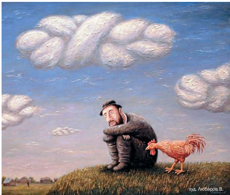
худ. Любаров В.

Но я уже не видел кто. Я сидел на снегу,