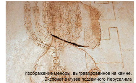
Изображение меноры, выгравированное на камне. Экспонат в музее подземного Иерусалима

Предание, конечно, очень интересное, но я, как историк, к подобным вещам отно-