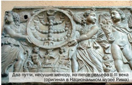
Два путя, несущие менору, на гипсе рельефа II-III века (оригинал в Национальном музее Рима)

Поэтому не стоит смущаться при виде треугольного основания у меноры перво-священника в Иродианском квартале. Она сделана неправильно намеренно.