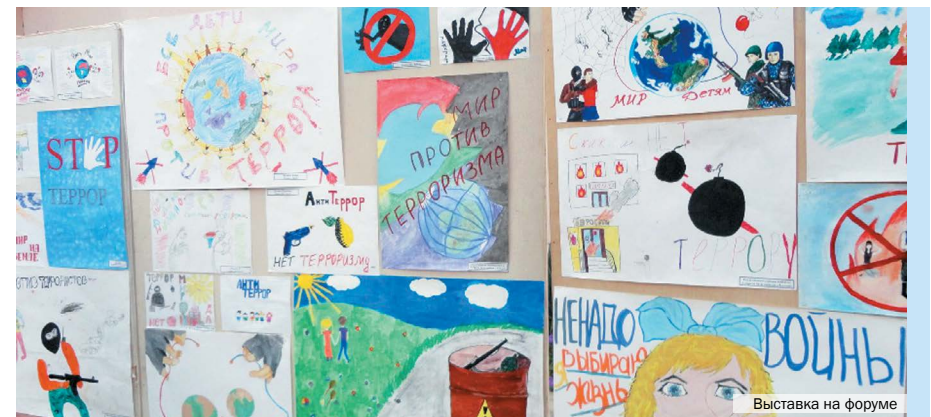
Выставка на форуме