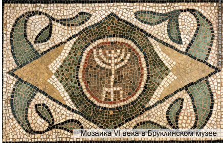
Мозаика VI века в Бруклинском музее

Посмотрите на другие, менее известные древние изображения меноры. На одних