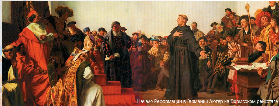
Начало Реформации в Германии Лютер на Wormsском рейхстаге

Новый Завет в немецком переводе, сделанном Лютером, распространялся по германским землям, как пожар по сухому лесу. Очевидец вспоминает, что все, кто знал грамоту, жадно читали и перечитывали