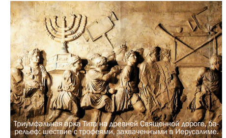
Триумфальная арка Тита на древней Священной дороге, барельеф: шествие с трофеями, захваченными в Иерусалиме.

кованием забрали с собой и изобразили на арке Тита. А восставшее из пепла спустя две тысячи лет еврейское государство изобразило поддельную менору на своем гербе, в то