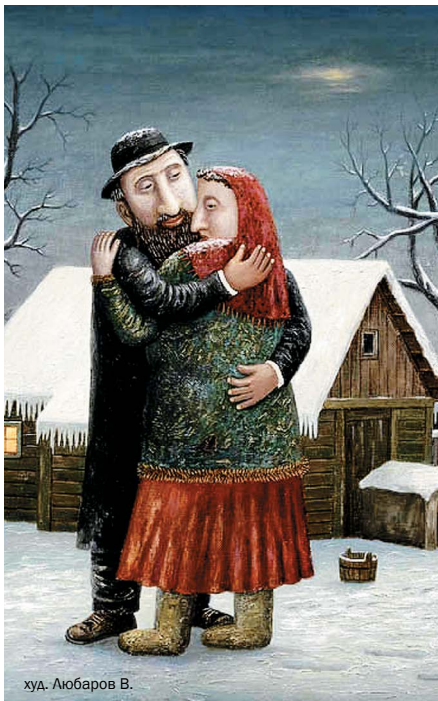
худ. Любаров В.

Будучи евреем, приехавшим из Советского Союза, отсидевшим полтора года в тюрьме за пропаганду идей сионизма, прошедшим длинный путь от «простого советского человека» до религиозного еврея, пройдя все трудности адаптации в новой стране, я знаю, как все это непросто. У меня на это ушли годы. Да что там годы, вся жизнь. Поэтому, встретив в синагоге незнакомое лицо, я сразу понял: передо мной новый репатриант. Я поинтересовался у немолодого мужчины, откуда он, и кто привел его в синагогу? Его звали Изя, и ответ был коротким и неожиданным: