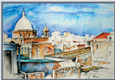
Хайфа, нижний город (акварель Юры)

Следующее испытание пришло с неожиданной стороны. В 2012-ом году у меня на языке появилась небольшая рана. Я думал, что это из-за неправильного лечения зуба, и не придавал большого значения. Но ранка беспокоила все больше, а лечение, которые мне предлагали врачи, не помогало. После биопсии выяснилось: рак языка. Мне предложили лечение химиотерапией в течение