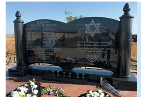
Мемориал в с. Степное