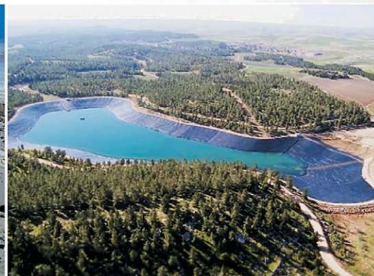
Пустыня Негев сегодня.

Слава Богу за Израиль! Да Будет благословен Всевышний!