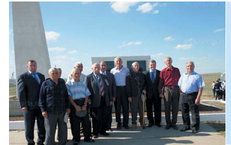
Мемориал в Арзгире