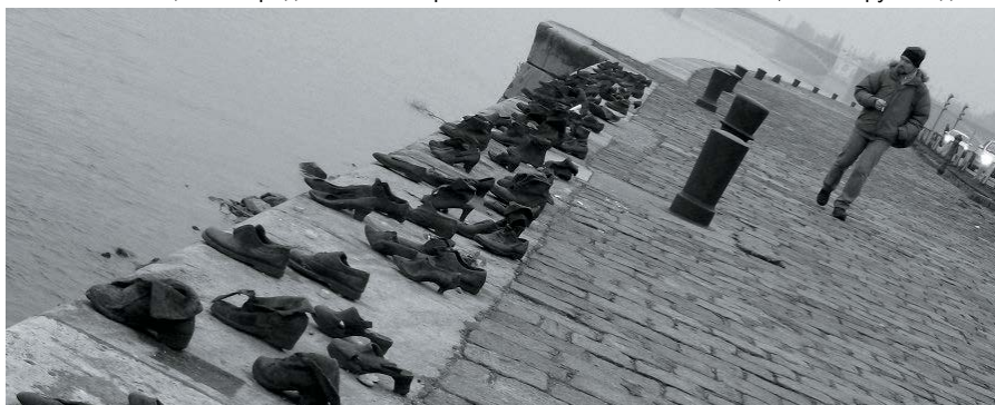
Мемориал жертвам Холокоста на берегу Дуная в Будапеште

Кто-то может не обратить на эти события никакого внимания, но вот руководство