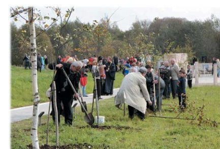
Аллея Праведников в Любавичах