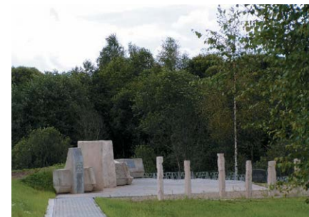
Мемориальный комплекс в Любавичах