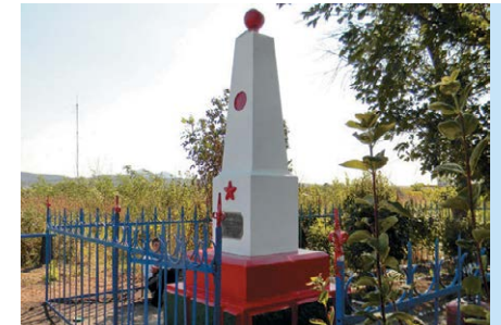
Памятник в Минеральных Водах

Ключевыми событиями, организованными церквями-участниками Иудео-христианского