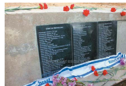
Восстановленные имена убитых