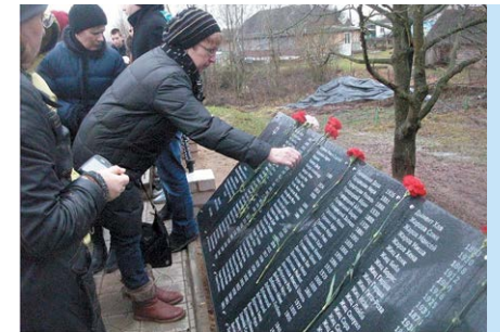
Мемориал в Монастырщине