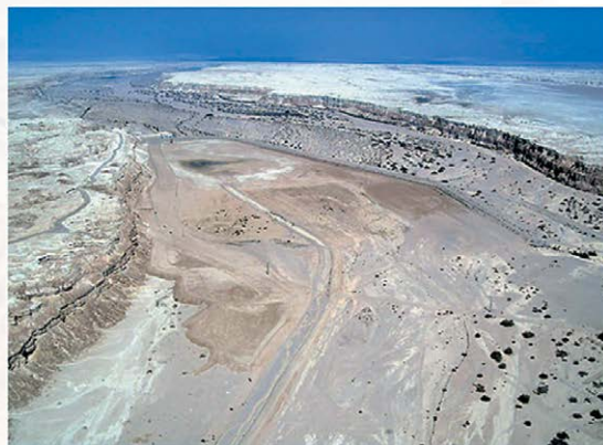
Пустыня Негев в 1956 году.

17. В Израиле первыми удалили опухоль из головы безопасным методом.