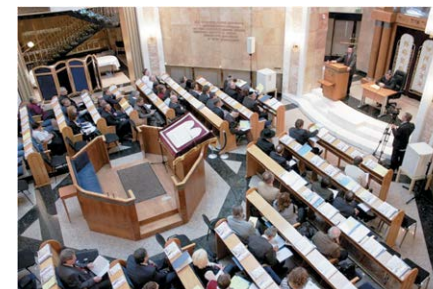
Круглый стол 27.05.2010

В мае 2013 года начались работы по реконструкции, ремонту и идентификации места захоронения в поселке Монастырщина – до войны самом крупном еврейском местечке Смоленской области. 24 ноября 2013 года был открыт обновленный мемориал на месте расстрела евреев Монастырщины и Дудино.