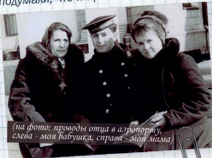
(на фото: проводы отца в аэропорту, слева - моя бабушка, справа - моя мама)